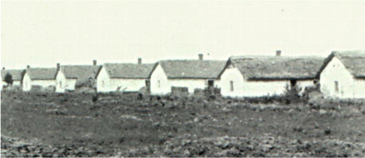
„Bánatfalva” 1954-ben, a borsósi tábor felszámolása után.

A letelepítésnek végül is Sztálin halála vetett véget, amikor a telepesek előtt is megcsillant a szabadulás lehetősége. 1953 nyarán megkezdődött a táborrendszer felszámolása. A falu-kezdemények (többnyire alap nélkül épült) vályogházai idővel belemosódtak a földbe. Az 1953. július 22-i amnesztiarendelet nyomán 2524 telepes család hagyhatta el Hortobágy és Nagykunság pusztáit. Még azok közül is kevesen maradtak az állami gazdaságokban, akik rabságuk vége felé házépítésbe kezdhettek. A falvasítási program, „kulákfalvak” nélkül, később valósult meg.