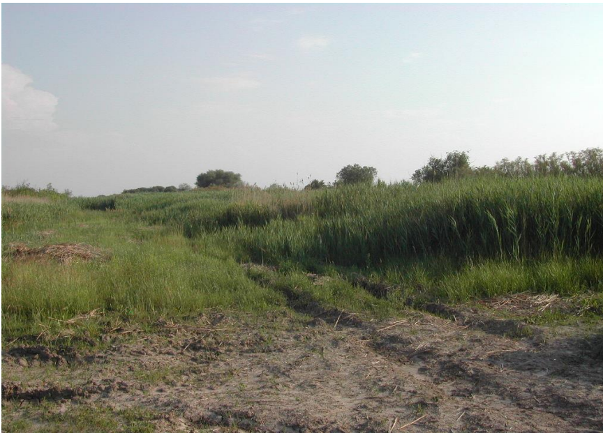
Borsós – „Bánatfalva” helye 2006. júniusában.

A letelepítésnek végül is Sztálin halála vetett véget, amikor a telepesek előtt is megcsillant a szabadulás lehetősége. 1953 nyarán megkezdődött a táborrendszer felszámolása. A falu-kezdemények (többnyire alap nélkül épült) vályogházai idővel belemosódtak a földbe. Az 1953. július 22-i amnesztiarendelet nyomán 2524 telepes család hagyhatta el Hortobágy és Nagykunság pusztáit. Még azok közül is kevesen maradtak az állami gazdaságokban, akik rabságuk vége felé házépítésbe kezdhettek. A falvasítási program, „kulákfalvak” nélkül, később valósult meg.