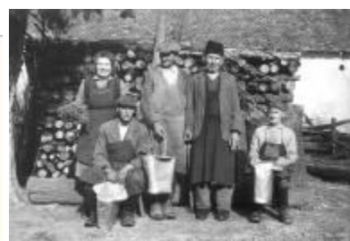
Néhány megmaradt családi fénykép

A táborfolklor több esetet megőrzött, amikor a rabtáborban sokaknak személyes tulajdonságaikkal (bátorság, vidámság, munkabírási, gondoskodó segítőkészség, leleményesség stb.) sikerült kivívniuk új rangot. A rabtartók éppen ilyen „hősök” ellen léptek fel éberren, és megfélemlítésekkel, kollektív büntetésekkel, kegyetlenkedésekkel igyekeztek elejét venni annak, hogy új tekintélyek, rangok teremődjenek.